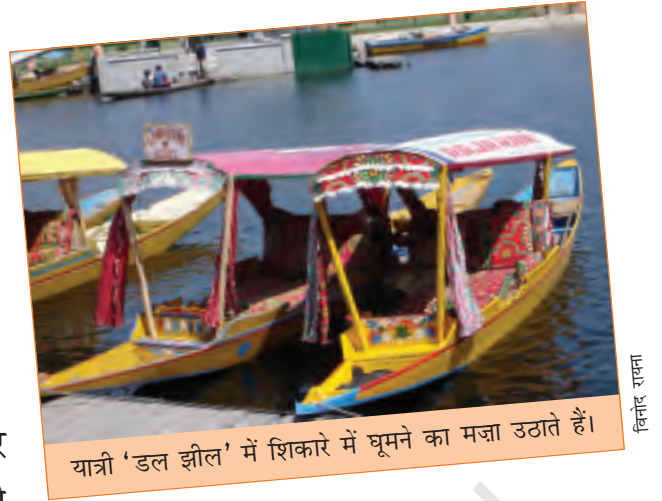
यात्री 'डल झील' में शिकारे में घूमने का मज़ा उठाते हैं।

अपने सफ़र की शुरुआत पर निकलने से पहले मैंने कभी सोचा भी न था कि एक ही राज्य में मुझे इतनी तरह के घर और लोगों के रहन-सहन के तरीके देखने को मिलेंगे। लेह में एक अनुभव था दुनिया की चोटी पर रहने का और श्रीनगर में अनुभव था पानी पर रहने का। इन इलाकों में घर भी ऐसे खास थे जो वहाँ के मौसम के अनुकूल थे।